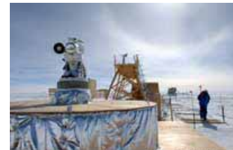
Base d'astronomie Concordia