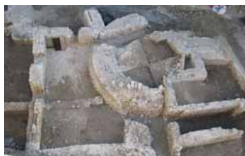
Fouilles du Tramway de Nice - Vestiges de la tour Patrolière et de la chapelle Saint-Sébastien (XIV e -XVII e s.).